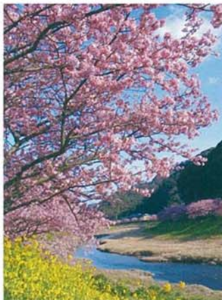
青野川沿いの桜と菜の花